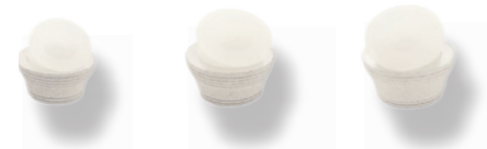
Durchmesser: 9 mm 10 mm 11 mm Artikel-Nr.: WMC109 WMC110 WMC111