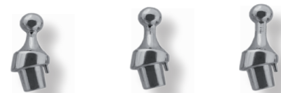
Artikel-Nr.: Kurz WMEC Mittel WMEM Lang WMEL